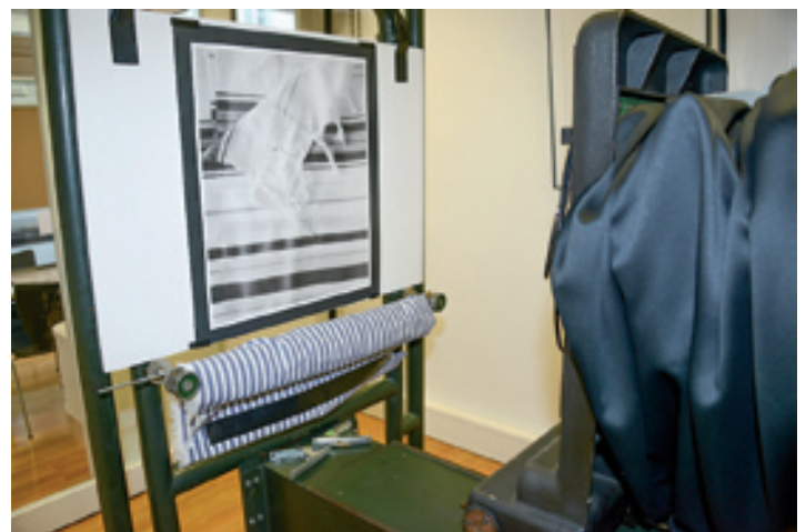
Es sind analog fotografierte Stillleben, die vollständig analog mit einer Klimsch Reprokamera aus dem Jahr 1957 entstehen. Die Belichtung erfolgt jeweils auf ein spezielles 50 cm x 60 cm großes, schwarz-weiß Positiv-Fotopapier – ohne den Umweg über ein Negativ. Durch die direkte Belichtung auf das Fotopapier ist jede Aufnahme daher ein Unikat innerhalb einer kleinen Auflage. Hier bildhaft festgehalten sind Vorbereitungen der entsprechenden Aufnahmen zum Stillleben „Kippa“

Bild über das bloß Gesehene hinaushebt. Im Fall von „Kippa“ begann die Umsetzung mit einer gezielten Suche nach unterschiedlichen Objekten. Zunächst recherchierte Dreisörner in verschiedenen Webshops, deren Angebot sich jedoch als unerwartet begrenzt erwies. Die benötigten Kippot konnten schließlich nicht digital, sondern ganz klassisch im Shop eines jüdischen Museums erworben werden. Der anschließende Aufbau des Sujets stellt eine besondere Herausforderung dar. Bedingt