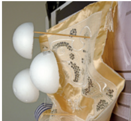
Das Arrangement der einzelnen Elemente muss sicherstellen, das es im Raum stabil bleibt und zugleich im Bild eine präzise Komposition ergibt: Vorbereitung einer Aufnahme zum Stillleben „Kippa“

So auch bei der vorliegenden Arbeit „Kippa“, die sich mit jüdischem Leben in Deutschland heute auseinandersetzt: einerseits wieder sichtbarer Bestandteil des Alltags, andererseits geprägt von wachsender Verunsicherung angesichts zunehmenden Antisemitismus. Die Übersetzung dieser Idee in ein Stillleben bildet den eigentlichen künstlerischen Kernprozess. Bedingt durch die Arbeit mit seiner großformatigen Reprokamera entsteht das Bild ausschließlich im Studio, Menschen und Bewegung sind ausgeschlossen. Das verlangt eine präzise, oft metaphorische Bildsprache. In einem nächsten Schritt wird die innere Bildvorstellung kritisch überprüft: Auf Plausibilität, ästhetische Spannung und jene feine Balance zwischen Vertrauen und unerwarteter Irritation, die ein